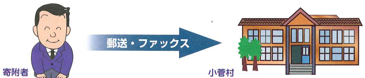
図2: 寄附金は、「納付書払い」とさせていただきます。

図1:裏面の「寄附申込書」にご記入の上、小菅村役場までファックス又は郵送でお申し込みください。