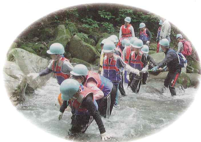
未来の子どもたちを育てる事業